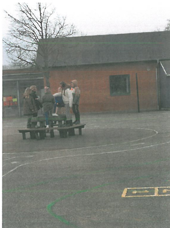
Skolegården på Friskolen Velle Man. d. 6. Feb 2023. På billedet kan man se et vindu der har fået gitter på, og bænken er blevet fjernet

Der har været meget snak, om muligheden for at lave et sted for børnene at spille mur, uden at børnene skal tænke på, at de ødelægger et vindue eller bænken. Så nu har de voksne på lærerværelset fra Friskolen Velle, endelig sagt de skulle havde fjernet bænken og et gitter op for vinduet, så børnene kan spille mur trygt.